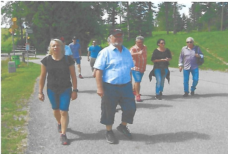
Wandern mit "social distancing"