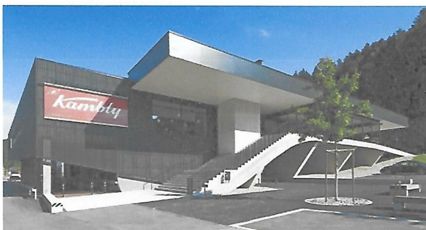
Kambly-Welt und Fabrikladen