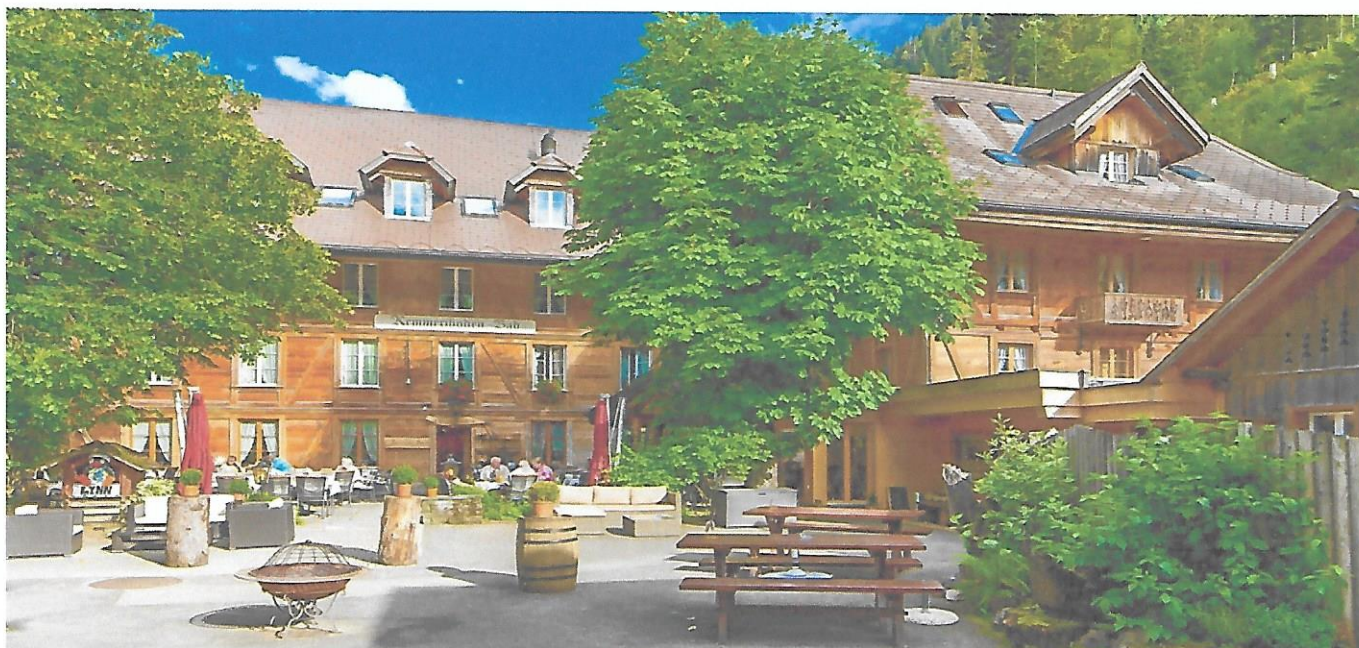
Hotel, Landgasthof Kemmeriboden-Bad